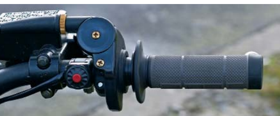
Schont den daumen, ist sportlich: Drehgas ist Serie