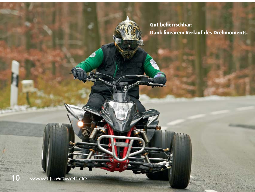
Gut beherrschbar: Dank linearem Verlauf des Drehmoments.