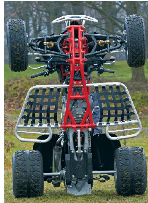
Alles drum und dran: Das Set-Up und die Ausstattung stimmt.

Herstellerangaben / * = Meßwerte Quadwelt