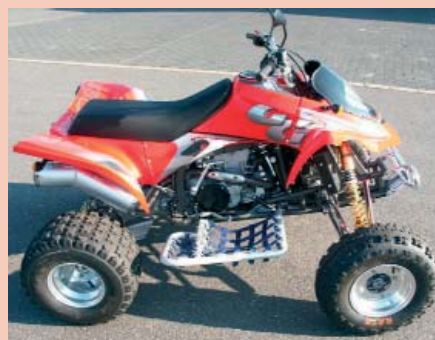
Premiere 2005: Die erste Wild HP mit kompletter Ausstattung und breitem Fahrwerk.

GasGas stammt von der iberischen Halbinsel. Nahe Barcelona bauen die Spanier erfolgreich Trial- und Enduro-Motorräder. Mit einem Marktanteil von knapp 41 Prozent im Trial-Sport zählt die Marke dort zu den ganz großen. Edle Enduros im klassischen Sinn bringt man ebenso auf die Strecken. So zeichnen sich sowohl die Zwei- als auch die Viertakter durch eine beherrschbare Leistungsentfaltung und breitem Drehzahlband aus. Drehmo-