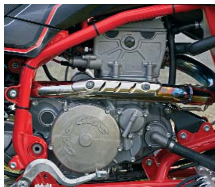
Kraftvoll, aber beherrschbar: Der Motor aus dem Enduro-Sport.