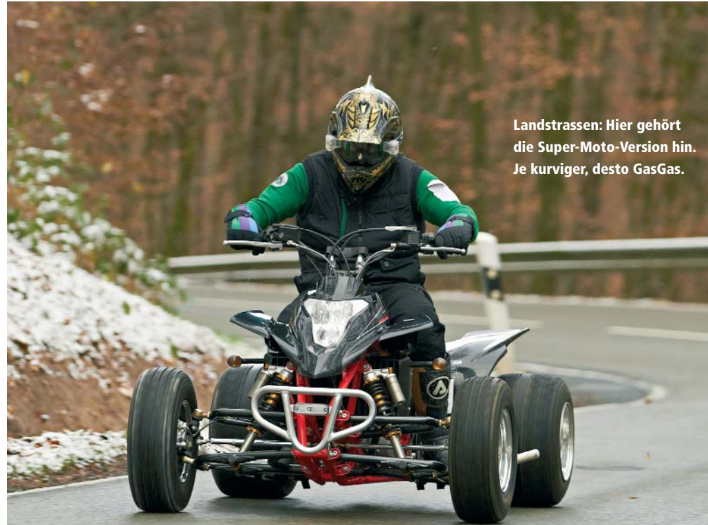
Landstrassen: Hier gehört die Super-Moto-Version hin. Je kurviger, desto GasGas.

Bevor wir uns mit dem Quad auf unsere Teststrecke wagen, wollen wir erst einmal ein paar kleinere Runden auf einem abgesperrten Gelände fahren um uns an das Fahrzeug zu gewöhnen. Hierbei uns die recht schwergängige Lenkung auf. Es ist schon einiger Kraftaufwand nötig, bis die Lenkbefehle umgesetzt werden. Wir schauten direkt noch einmal nach um sicherzugehen das wir keinen Lenkungsdämpfer übersehen hatten, aber das war nicht der Fall. Es fühlte sich jedenfalls so an als wäre hier einer verbaut. Weiterhin trennte die Kupplung nicht ordentlich und der Leerlauf ließ sich nur mit viel Gefühl einlegen. Da es sich um ein Neufahrzeug mit eben mal 15 Kilometern auf dem Tacho handelte war dies sicherlich ein Einzelproblem und sollte sich durch Einstellen der Kupplung beheben lassen. Nach einigen Proberunden fühlten wir uns wohl und wollten nun endlich sehen wie sich das Fahrzeug in seinem bevorzugten Terrain, nämlich der Landstraße verhält. Also ab und rauf auf eine bergige und kurvenreiche Strecke durch das Kasseler Land. Obwohl die Temperaturen um den Gefrierpunkt lagen und die Straßen noch nass waren, was sicherlich nicht ideale Testbedingungen sind, fühlten wir uns sofort wohl und liebten