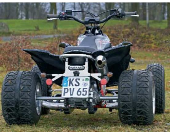
Heckansicht: Dura-Blue spendiert die Achse.

ordentliche Breite. Das Kettenrad und die Bremsscheibe werden durch einen Plastik-Unterfahrschutz vor Beschädigungen geschützt. Die Supermoto Version ist mit Goldspeed "Gelb" Straßenreifen in der Dimension 225/40/10 (hinten) und 165/70/10 (vorne) auf Douglas Alufelgen ausgestattet, welche eine gute Haftung versprechen.