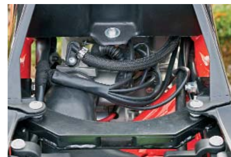
Sitzbank runter: Ordnung muss sein!