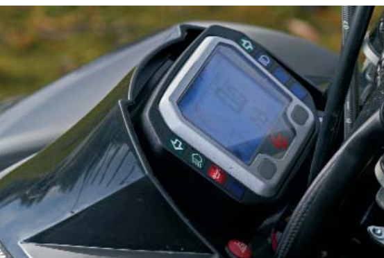
Edleitel im Cockpit: Hier arbeitet der bewährte Acewell-tacho.