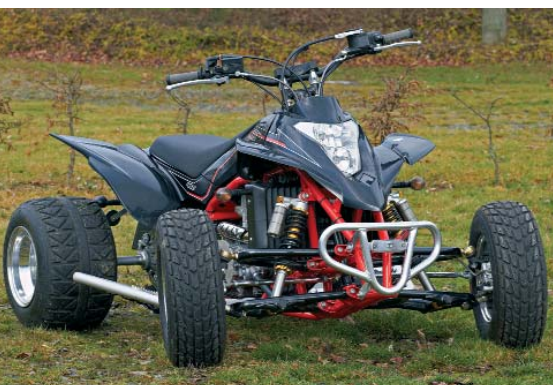
Flacheisen: Die Super-Moto liegt tief. Gut für die Kurvenhatz.