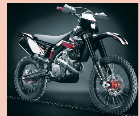
Edel und funktionell: Die Enduro. Deren Motor arbeitet ebenfalls im 2010er Quad.

gangenheit beseitigt und ist sicherlich auf dem richtigen Wege. Sowohl der sportlich ambitionierte Straßenfahrer sowie der Tourenfahrer werden Ihre Freude an dem Fahrzeug haben. Die umfangreiche und hochwertige Serienausstattung sowie E-Zulassung machen das Quad zu einem ernsthaften Konkurrenten im 450er Segment. Der Preis ist angesichts der gebotenen Ausstattung interessant. Verarbeitung und Motorleistung können sich allemal sehen lassen. Nach unserem Empfinden hat man hier den richtigen Weg eingeschlagen um ein Quad strabentauglich zu machen. Bleibt zu hoffen das sich GasGas mit der Wild HP450 nun im deutschen Markt behaupten kann. Erste Erfolge im Motorsport - Sieger Mefo-Shorttrack-Challenge 2009 zum Beispiel - sprechen jedenfalls dafür!