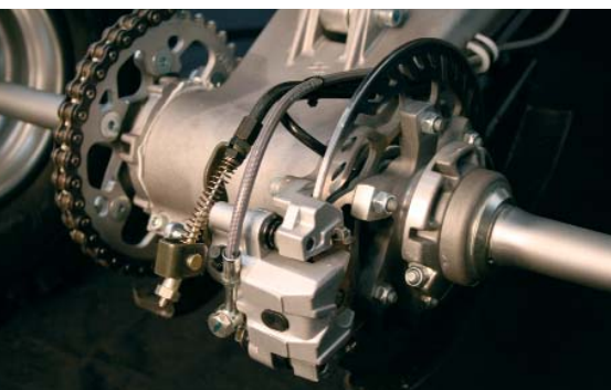
Packende Sache: Die Bremsen arbeiten gut