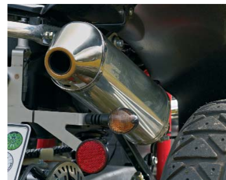
Brauchste nicht kaufen: Die GaasGas hat bereits eine Renntüte.